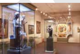
Древнейшие экспонаты музейного собрания – археологические находки VI тыс. до н.э.

единственный в России и один из немногих музеев в мире, экспозиции которого представляют историю возникновения и развития религии. Фонды музея насчитывают около 200 000 экспонатов: это памятники истории и культуры разных стран, эпох и народов, от архаики Древнего Египта и Израиля до раннего европейского Средневековья; от Древней Греции и Рима до новейшего времени; буддизм и ислам.