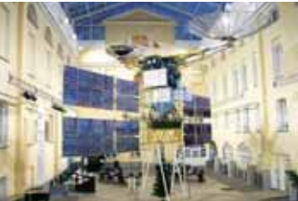
ЦЕНТРАЛЬНЫЙ МУЗЕЙ СВЯЗИ ИМЕНИ А.С. ПОПОВА, ПОЧТАМПТСКИЙ ПЕР. 4

Один из старейших технических музеев мира. Основанный в 1872 г., музей возрожден и вновь открылся для посетителей в мае 2003 г. после длительного перерыва, вызванного аварийным состоянием здания. Музей размещается во дворце, построенном итальянским архитектором Дж. Кваренги в последней четверти XVIII века для князя А.А. Безбородко (1747-1799). В 1829 г. дворец был продан почтовому ведомству России, и на протяжении почти ста лет дворцовые помещения приспособились к нуждам почтово-телеграфного департамента.